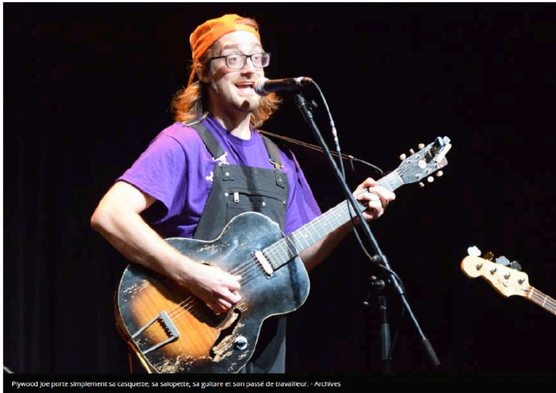
Plywood Joe porte simplement sa casquette, sa salopette, sa guitare et son passé de travailleur.