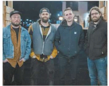
Le groupe La Patente se produira à la FrancoFête en Acadie.

La FrancoFête constitue un grand marché pour les diffuseurs de l'Atlantique qui préparent leurs prochaines saisons de spectacle. En voyant les 20 tournées qui circuleront chez 28 membres de Radarts pour un total de 127 représentations au cours de la prochaine saison, Mme Comeau considère que la relance augure plutôt bien. Le réseau scolaire Cerf-Volant se remet également sur pied avec dix tournées dans les écoles en présentiel.