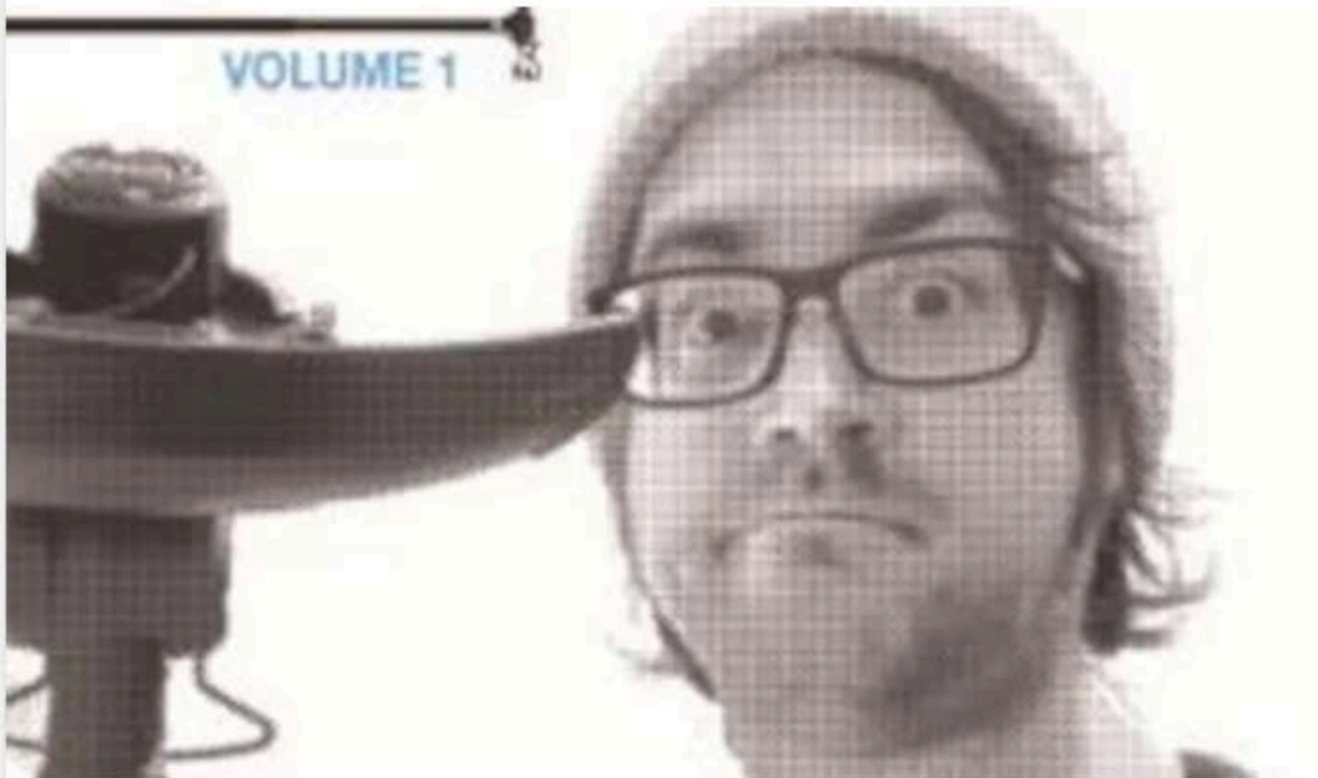
La pochette de l'album « Et les mangeux de baloni (Vol. 1) » de Plywood Joe.